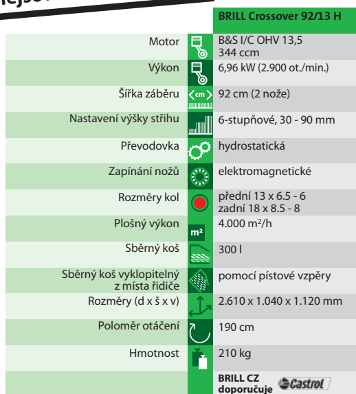
Crossover 92/13 H

další dostupné modely nejdou uvedeny v letáku